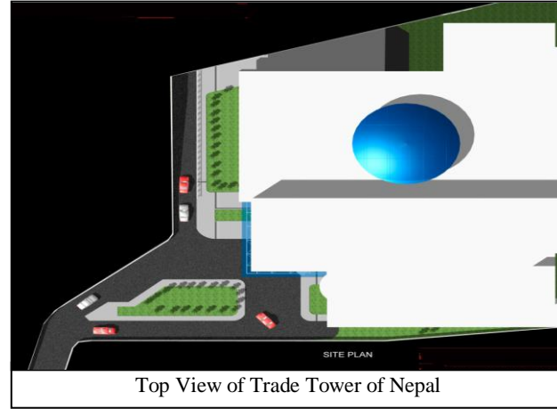
Top View of Trade Tower of Nepal

यस परियोजनाको लागि उपलब्ध जमिन नेपालको राजधानी शहरको केन्द्रविन्दुमा रहेको हुनाले यस ठाँउमा बसी काम गर्न सबैको अभिरुचि हुनेछ । यस भवनका प्रत्येक तल्लामा करिव २७,००० वर्गफिट क्षेत्रफल हुनेछ । साथै Basement मा पाकिङ्गको सुविधालाई ध्यानमा राख्दै भित्र जान र बाहिर आउनुको लागि बाटो हुनेछ । यो भवन निर्माण गर्दा प्रचलित नेपाल सरकारको मापदण्ड तथा वास्तुशास्त्रको समेत ध्यानमा राखी निर्माण सम्पन्न गरिनेछ । कम्पनीहरूका लागि सचिवालय सेवा, लगातार विद्युत आपूर्तिको लागि जेनेरेटर, Fire Fighting, Lift, Escalator एवं Emergency Evacuation को सुव्यवस्था मिलाइनेछ ।