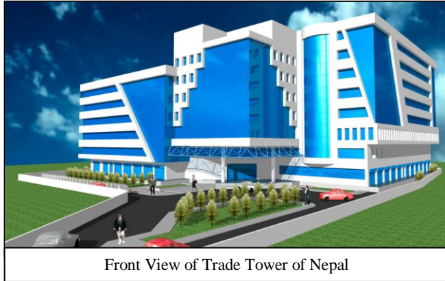
Front View of Trade Tower of Nepal

यो जमिन थापाथली राजमार्गबाट ७५ मिटर भित्र अवस्थित छ । यस जमीनमा संलग्न नक्सा अनुसारको एक आधुनिक भवन निर्माण गरिनेछ । भवनको प्रवेशमार्गको दायाँतर्फ १८ वटा आधुनिक पशालहरू स्थापना गरिनेछन् भने आठ मिटर चौडा पक्क सडक निर्माण गरिनेछ । भवनको तल्लो तल्लामा Food Court , मनोरंजन केन्द्र तथा केही